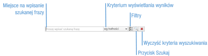
Rysunek 1: Wyszukiwarka globalna