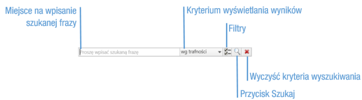
Rysunek 1: Wyszukiwarka globalna