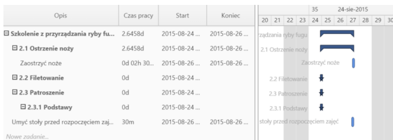
Przykładowy wykres Gantta w sprawie